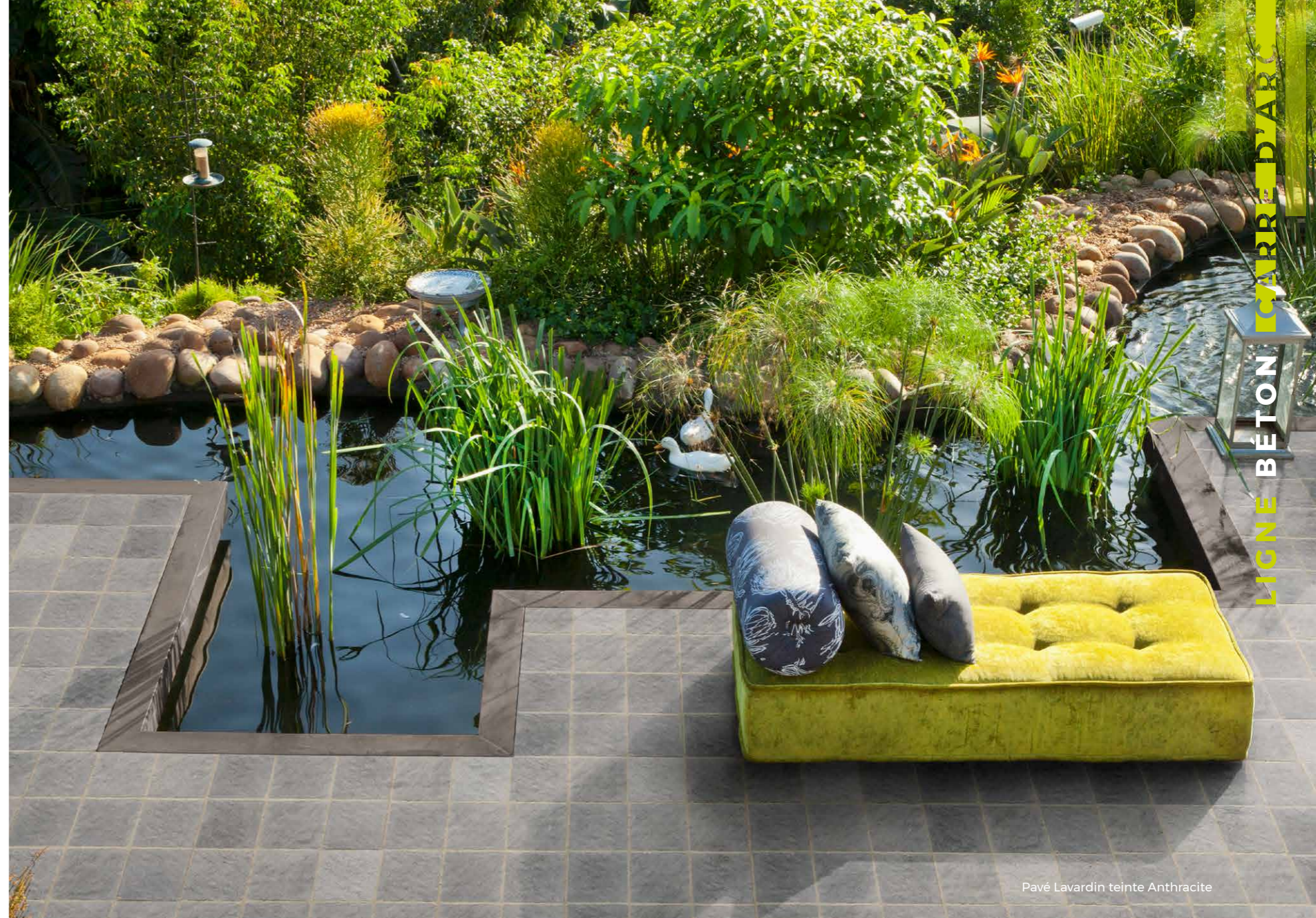
Pavé Lavardin teinte Anthracite