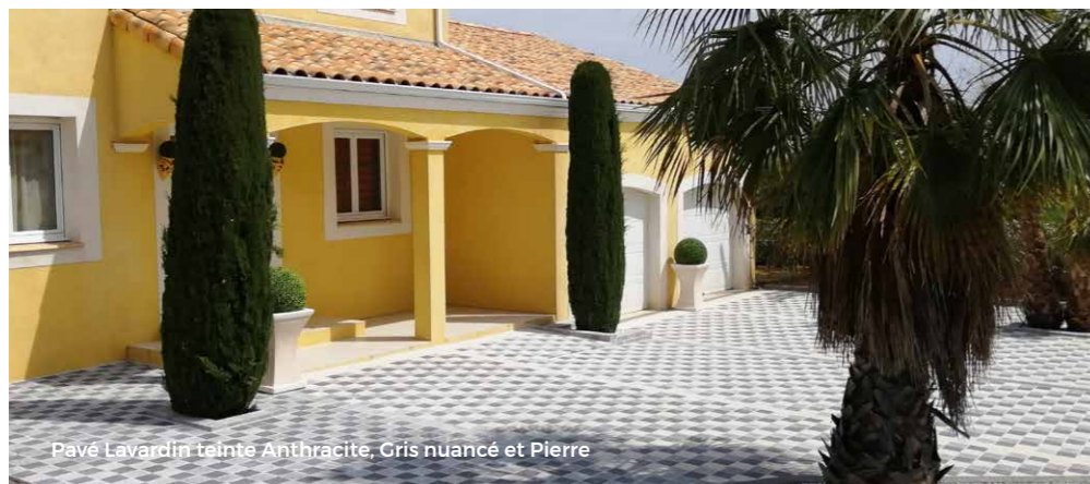
Pavé Lavardin teinte Anthracite, Gris nuancé et Pierre