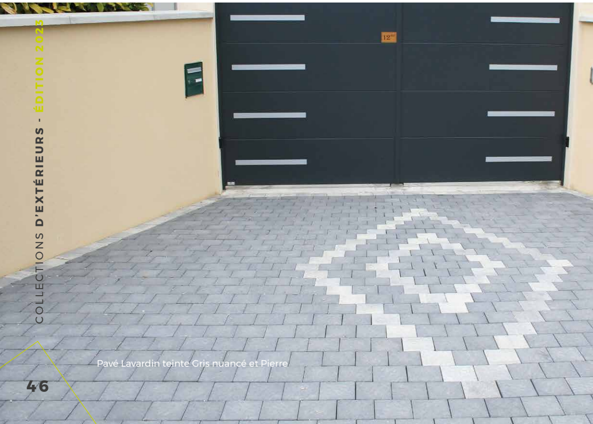
Pavé Lavardin teinte Gris nuancé et Pierre